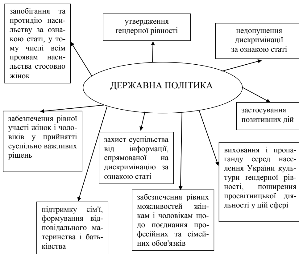
Рис. 3. Основні напрями державної політики щодо забезпечення рівних прав та можливостей жінок і чоловіків