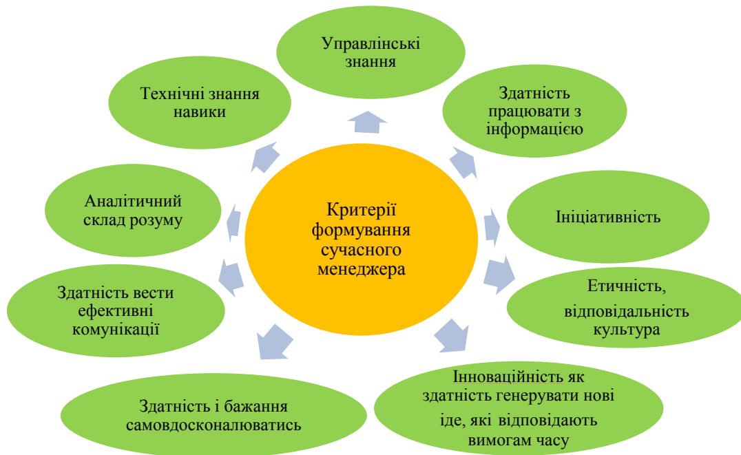
Рис. 2. Критерії формування компетенцій сучасного менеджера

Необхідно зазначити, що дорожня карта формування компетенцій менеджера має не тільки