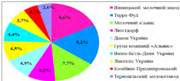
Рис. 3. Чистки ринку виробників молочної продукції в Україні у 2017 р. [7]

набагато менше, ніж експорту, але у відносному вимірі він значно виріс (табл. 6).