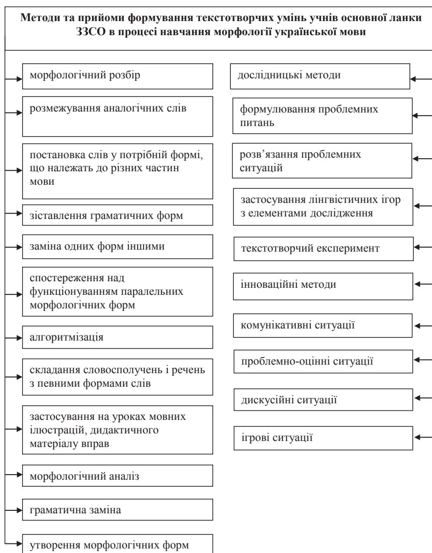
Рис. 1.2. Методи та прийоми формування текстотворчих умінь учнів основної ланки ЗЗСО в процесі навчання морфології української мови на основі лінгводидактичного аналізу

Так, наприклад, Н. Бородіна вважає, що лінгводидактичний аналіз формування текстотвор-