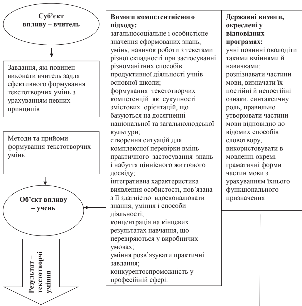
Рис. 1.3. Лінгводидактичний аналіз формування текстотворчих умінь учнів основної ланки ЗЗСО у навчанні морфології української мови