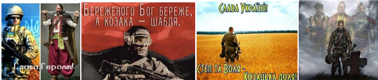
Рис. 6. Проєкції історичної пам'яті