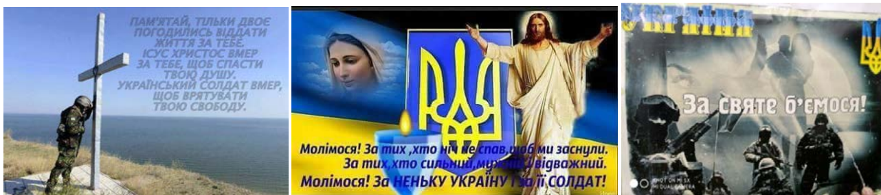
Рис. 5. Апеляція до релігії

Ми в бій підемо і вмеремо гідно, з любов'ю віддамо життя! Хай Воїн – Лицар кров'ю оросить свій меч на захист Батьківщини, хай клич до бою в серці зродить «НАВЕКИ СЛАВА УКРАЇНІ»!!! Слід звернути увагу, що в інтернет-мемах меч зображується поверненим вістрям вниз, а не вгору, що асоціюється більшою мірою з мечем правосуддя ніж з бойовим мечем. Сакралізація війни призводить до тотальної героїзації своїх військових: боротьба за незалежність розглядається як наслідування шляху Христа, що втілено в реальному житті як свідомий і добровільний вибір особистості, який продиктований її моральними цінностями: Пам'ятай, тільки двоє погодилися віддати життя за тебе: Ісус Христос вмер за тебе, щоб спасти твою душу; український солдат вмер, щоб врятувати твою свободу! (рис. 5).