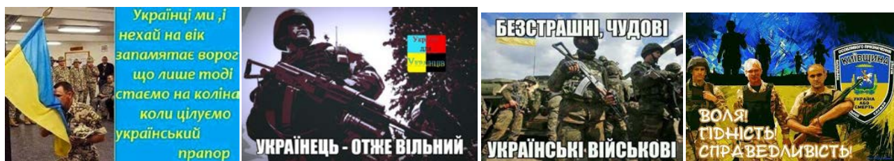
Рис. 2. Психологічний образ українського військового

(Благословенна та держава, що має відданих синів!); вільнолюбство (Українець – отже вільний; Воля! Гідність! Справедливість!), щирість (З Україною можна товаришувати – вона добродушна! З Україною можна співпрацювати – вона чесна! Україну можна попросити – вона щедра! З Україною не можна воювати – вона непереможна!), хоробрість (Безстрашні, чудові українські військові) (рис. 2).