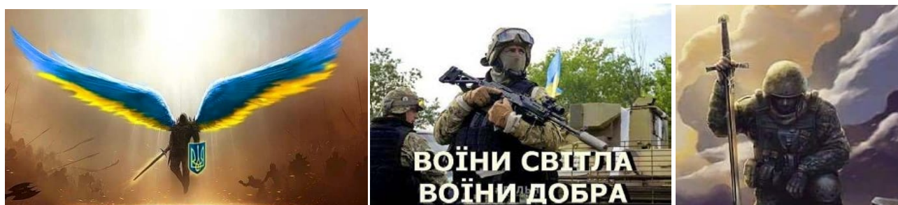
Рис. 4. Сакралізація образу українського військового