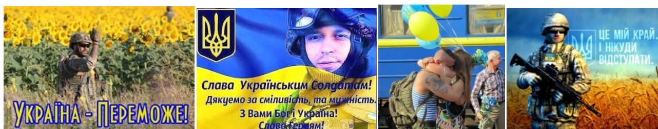
Рис. 8. Колористичні символи в інтернет-мемах

Висновки. Аналіз інтернет-мемів, що створені українською аудиторією інтернет-спільноти, дозволив виявити декілька проєкцій образу українського військового: 1) агресивно-дієвий, де представлено мілітаризований образ. Основні категорії, що формують семантичне поле образу є концепти війна , ворог ; 2) сакральний, що звеличує образ українського військового. Основні категорії, що формують семантичне поле образу – архетипи, символи міфології, містици, релігії; 3) світоглядний, де позиціонуються душевна доброта, гуманізм. Основні категорії, що формують семантичне поле образу, є візуальні – домашні улюбленці, пшеничне поле, блакитне небо, соняшники; 4) історичний, коли образ українського військового вбирає у себе частину історії. Основна категорія, що формують семантичне поле, –