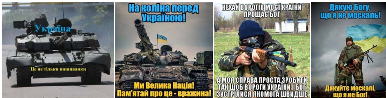
Рис. 1. Мілітаризований образ українського військового

Ключовою для розуміння ідеологічного наповнення інтернет-мемів стає текстова складова: Україна – це не тільки вишиванки; На коліна перед Україною! Ми – велика нація! Пам'ятай про це, вражина!; Нехай ворогів моєї країни прощає Бог, а моя справа проста – зробити так, щоб вороги України і Бог зустрілися якомога швидше; Дякую Богу, що я – не москаль! Дякуйте, москалі, що я – не Бог!; Коли сусіди приходять до тебе з війною – залишайся добрим і бажай їм миру і спокою... Вічного спокою; Київська Русь Московію породила – Київська Русь Московію і погубить; Це – мій край, і нікуди не відступати; Армія – гарант незалежності та територіальної цілісності України; В своїй хаті своя й правда, і сила, і воля; Я вбиваю ворогів не тому, що люблю вбивати! А тому, що люблю Україну!; Коли я піду – прийдуть інші. Це страшна сила – любов до України! В наведених прикладах мужність українських військових позиціонується як «мудра упорність в здійсненні цілей вічного розуму, яка здійснює ідею вічного блага, це – подолання перешкод, що стоять на шляху до благої мети, потребуючих зосередженості, концентрації душевних, фізичних і духовних сил» [2]. До ідеологічного циклу проєкцій образу українського військового слід також віднести інтернет-мему, що репрезентують такі психологічні характеристики, як нескореність ( Українці ми, і нехай на вік запам'ятає ворог, що лише тоді стаємо на коліна, коли цілуємо український прапор ), відданість