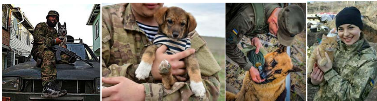
Рис. 3. Інтернет-меми з тваринами

Боротьба за незалежність та територіальну цілісність України постає в інтернет-мемах як споконвічна битва космічних сил Добра і Зла. Апелюючи до міфології, мистици, релігії, учасники досліджуваних інтернет-спільнот використовують символ «меч» як розпізнавчий знак вільної людини, сили (меч відомий як символ життєвої сили), гідності, вищої справедливості [1, с. 112]: За тебе, Рідна Україно, свята землянько моя.