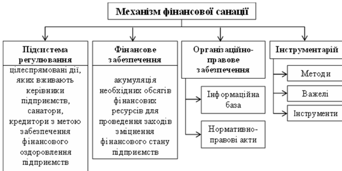
Рис. 2. Механізм фінансової санації