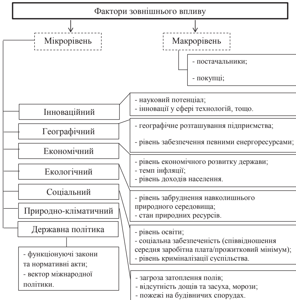
Рис. 2. Зовнішні фактори впливу на фінансовий стан підприємства [3, с. 265]

4. Продукція аграрного сектору має невисо- ку конкурентоспроможність, ніж в інших сферах економіки. При одній і тій же вартості, специфіка продукції потребує складських приміщень для її зберігання, має строк придатності, що варію- ється від умов, в яких зберігається, особливо транспорту для перевезення, що і є причиною збільшення витрат.