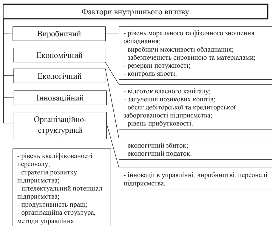
Рис. 3. Внутрішні фактори впливу на фінансовий стан підприємства [3, с. 265]

5. Багато в чому якість сільськогосподарської продукції залежить від погодних умов, які люди на не здатна контролювати. В деякі роки, коли погодні умови мали сприятливий характер, стан культур був високоякісним, тоді як в інші роки погодні умови були несприятливими і якість врожаю була гіршою.