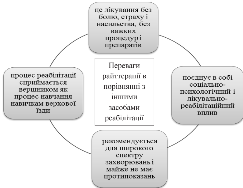
Рис. 2. Переваги райттерапії в порівнянні з іншими засобами реабілітації

Райттерапія – інноваційний метод реабілітації осіб з обмеженими можливостями, який являє в собі формою лікування людей верховою їздою. Позитивна динаміка лікування здійснюється завдяки використанню ритмічного впорядкованого моторного і сенсорного навантаження в тісній фізичній комунікації пацієнта і коня. Верховою їздою – складно-координаційний рух, особливістю якого є те, що м'язова діяльність відбувається в умовах рухомої опори і для збереження рівноваги необхідно поєднання центрів тяжіння вершника і тварини. Лікувальний ефект обумовлений біомеханічними факторами – це перш за все вплив коливань, що передаються при його русі, по строго заданої інструктором траєкторії на хребет, міжхребцеві диски, суглоби і навколишні їх тканини дитини. Потужний енергетичний і тепловий вплив, різноманітність рухів і відчуттів, які отримує дитина, перебуваючи на коні без