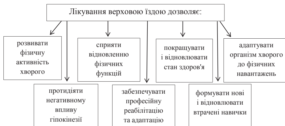
Рис. 4. Низка факторів, які супроводжуються лікуванням верховою їздою

У центрі кола знаходиться тренер – кордовий, керуючий конем за допомогою корди, бича, голосу. Коня на вольтижировці зазвичай облаштовують вольтижируючим сідлом, або гуртом (широка підпруга з ручками). Голова коня зазвичай фіксується «розв'язками». Найбільш легкими вправами вольтижировки є: перемахи, упори, стійки, вертушки, «ножиці», «ластівка», «куточок», соскоки і т.д. З вище перерахованих вправ складається певна комбінація (певної складності). В свою чергу з комбінацій складається комплекс вправ [4].