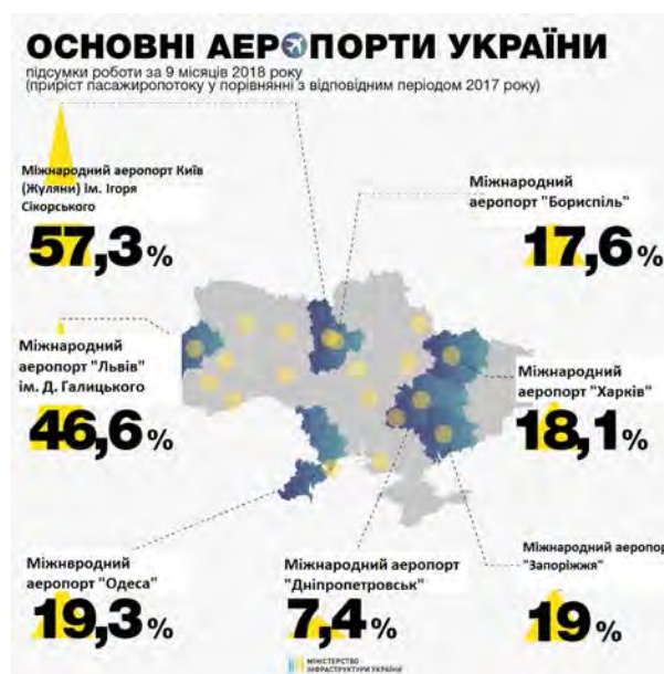
Рис. 1. Пасажиропотік в аеропортах 2018

Розпочнемо з головного аеропорту України – Міжнародний аеропорт «Бориспіль». За дев'ять