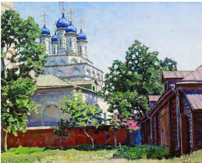
Илл. 16. А.М. Васнецов. «Троицкая церковь на Барсеневке». 1922 г. Х., м., 59,5 x 78,0 см // Музей истории и реконструкции города Москвы