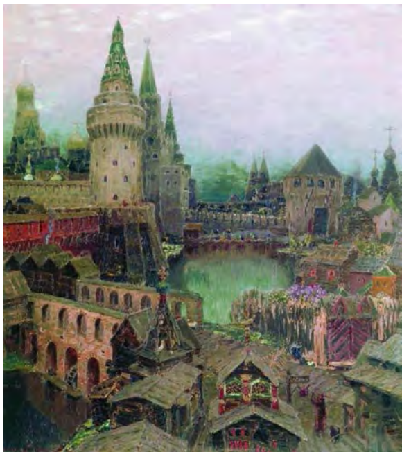
Илл. 12. А.М. Васнецов. «Москва конца XVII столетия. На рассвете у Воскресенских ворот». 1904 г. Х., м., 136,0 x 122,0 см

Своеобразным «прологом» к этому новому направлению в творчестве художника послужила работа над эскизами декораций к опере М.П. Мусоргского: «Хованщина» (1897) [1, с. 6]. Отсюда уже лишь один шаг к одновременно, появившимся в 1900 году большим картинам: «Улица в Китай-городе. Начало XVII века», «Москва середины XVII столетия. Москворецкий мост и Водяные ворота» и «Москва конца XVII столетия. На рассвете у Воскресенских ворот» [1, с. 6] (илл. 11, 12).