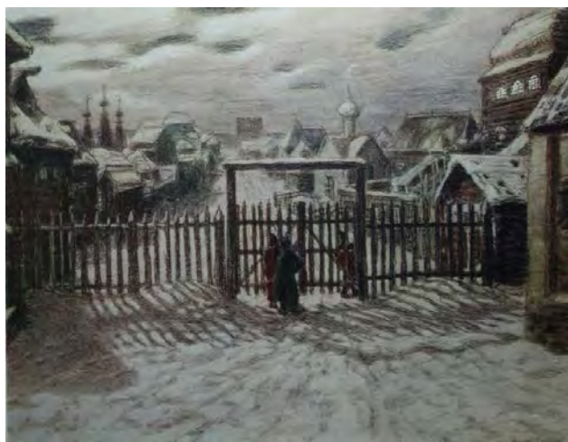
Илл. 14. А.М. Васнецов. «Уличная решетка. Ночь». 1903 г. Бумага на картоне, акварель, уголь, 46,4 x 60,4 см // Государственный Исторический музей (Москва)