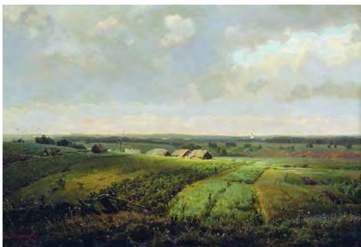
Илл. 5. А.М. Васнецов. «Родина». 1886 г. Х., м., 49,0 x 73,0 см // Государственная Третьяковская галерея (Москва)