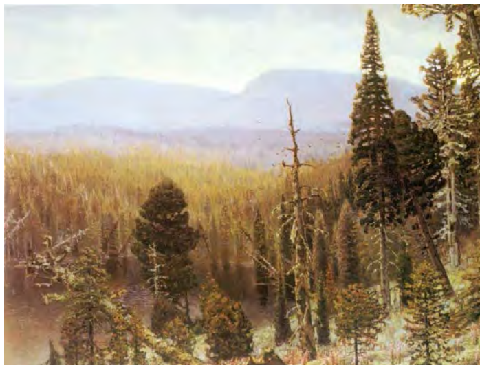
Илл. 7. А.М. Васнецов. «Тайга на Урале. Синяя гора». 1891 г. Х., м., 107,0 x 142,5 см // Государственная Третьяковская галерея (Москва)

Это произведения, в которых показан уже совершенно иной мир – древняя Русь, старая Москва. О первых шагах в данном направлении прекрасно сказал сам А.М. Васнецов: «Моя склонность к пейзажам исторического характера проявлялась в продолжении всей моей жизни. Но, первое, более ясное выражение этого сказалось, когда я в 1861 году перебрался в Москву и поселился в Кокоревском подворье, как раз напротив Кремля. Первое, что я сделал в этом роде, – это была иллюстрация к Лермонтовскому: «Кушцу Калашникову» – «Москва при Иване Грозном». Здесь мне впервые пришлось заняться графическим материалом по старой Москве. А там, что дальше, то больше: меня словно захватило что-то. Вообще, при моих исторических работах главнейшим материалом служили, прежде всего, графические изображения: планы