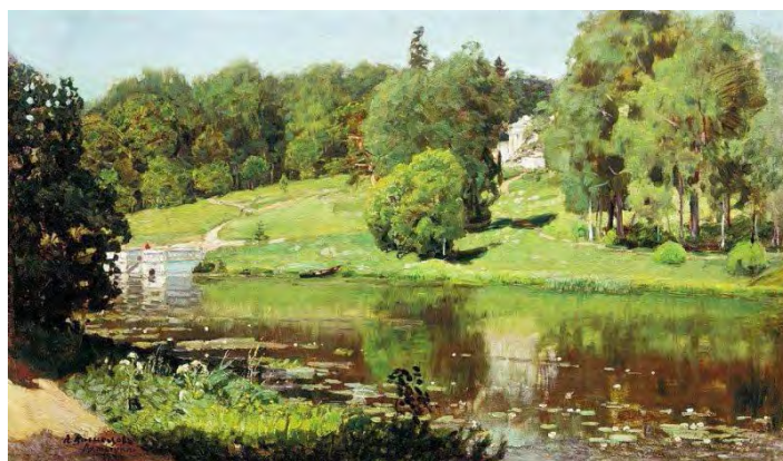
Илл. 3. А.М. Васнецов. «Ахтырка. Вид усадьбы». 1894 г. Х., м., 36,4 x 60,7 см // Государственная Третьяковская галерея (Москва)

в Крым, а позднее в 1896 году и на Кавказ. Однако, в больших картинах: «Серый денек» (1883), «Родина» (1886), «Днепр перед бурей» (1888) эволюция творчества художника проявилась далеко не столь быстро [1, с. 4] (илл. 4, 5).