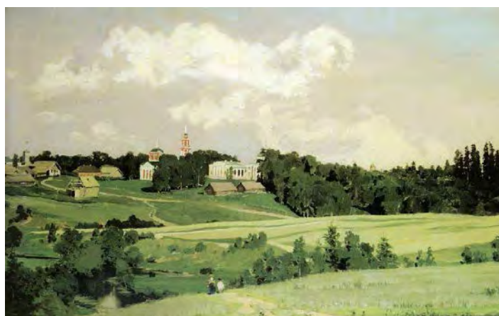
Илл. 2. А.М. Васнецов. «Ахтырка». 1880 г. Х., м., 34,0 x 49,0 см // Государственная Третьяковская галерея (Москва)