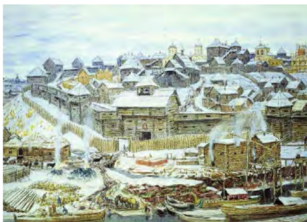
Илл. 15. А.М. Васнецов. «Московский Кремль при Иване Калите». 1921 г. Бумага на картоне, акварель, уголь, карандаш, 51,0 x 69,0 см // Музей истории и реконструкции города Москвы