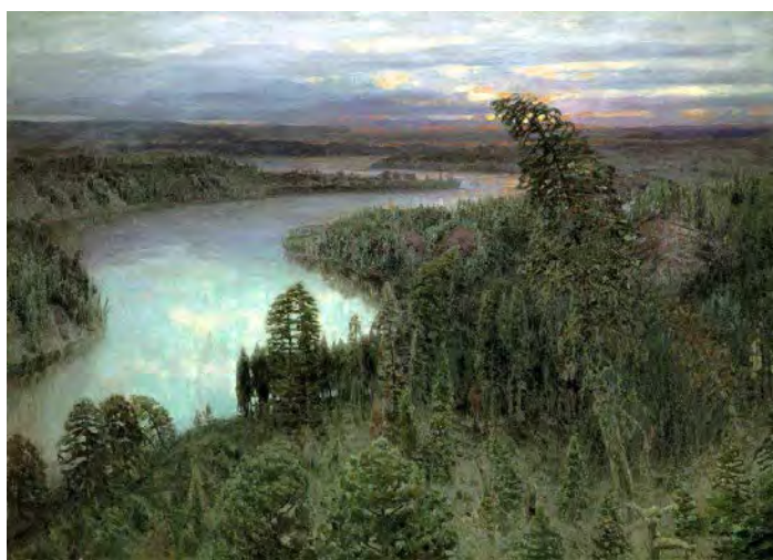
Илл. 9. А.М. Васнецов. «Северный край. Сибирская река». 1899 г. Х., м., 179,0 x 250,0 см // Государственный Русский музей (Санкт-Петербург)

старой Москвы, рисунки современных художников и путешественников, изображения на иконах и т.д.» [1, с. 6].