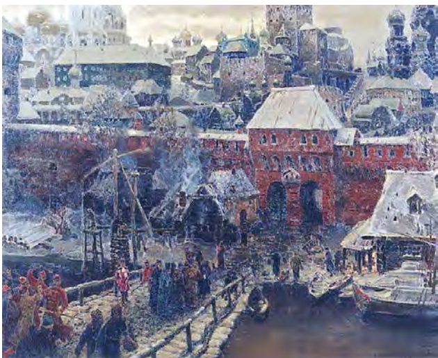
Илл. 11. А.М. Васнецов. «Москва середины XVII столетия. Москворецкий мост и Водяные ворота». 1900 г. Х., м., 141,0 x 176,0 см // Государственная Третьяковская галерея (Москва)