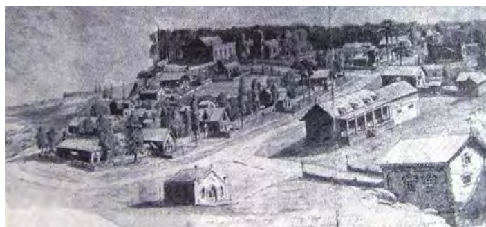
Илл. 1. А.М. Васнецов. «Идеальная деревня будущего». 1876 г. Б., кар., 26,0 x 53,0 см // Государственная Третьяковская галерея (Москва)

Влучших абрамцевских пейзажах А.М. Васнецова видно благотворное воздействие В.Д. Поленова. Заметному «высветлению» колорита в пейзажах А.М. Васнецова с 1880-х годов во многом содействовали и его поездки на юг – на Украину,