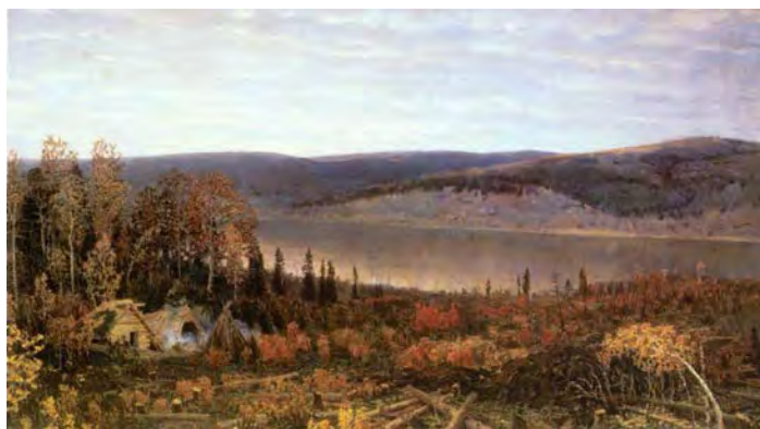
Илл. 8. А.М. Васнецов. «Кама». 1895 г. Х., м., 143,0 x 250,0 см // Государственная Третьяковская галерея (Москва)