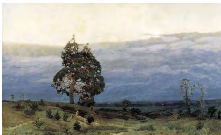
Илл. 6. А.М. Васнецов. «Сумерки». 1889 г. Х., м., 113,0 x 176,5 см // Музей русского искусства (Киев)

«Серый денек» исполнен художником в характерной манере пейзажей ранних передвижников: скромная цветовая гамма, простой, непритязательный с виду уголок природы, одинокая фигура человека – все это как будто бы не предвещало ничего нового [1, с. 4]. Но, уже в следующем значительном произведении А.М. Васнецова – «Родина», а также в его картинах: «Днепр перед