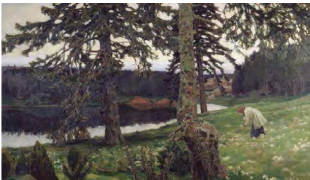
Илл. 10. А.М. Васнецов. «Озеро». 1902 г. Х., м., 124,2 x 211,0 см // Государственная Третьяковская галерея (Москва)