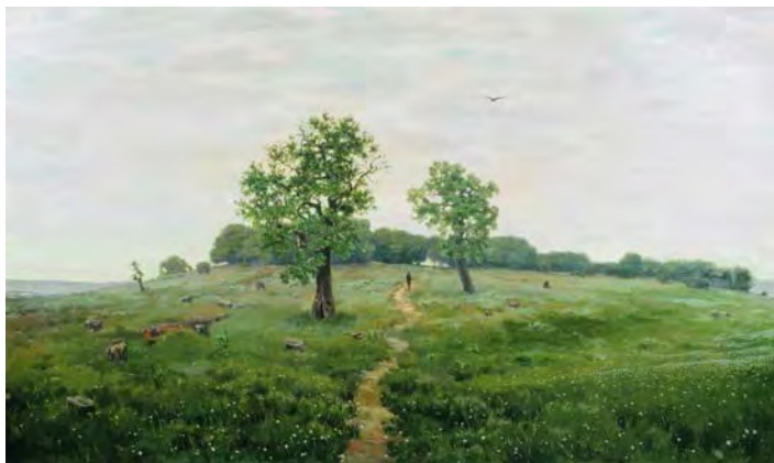
Илл. 4. А.М. Васнецов. «Серый денек». 1883 г. Х., м., 54,5 x 89,5 см // Государственная Третьяковская галерея (Москва)