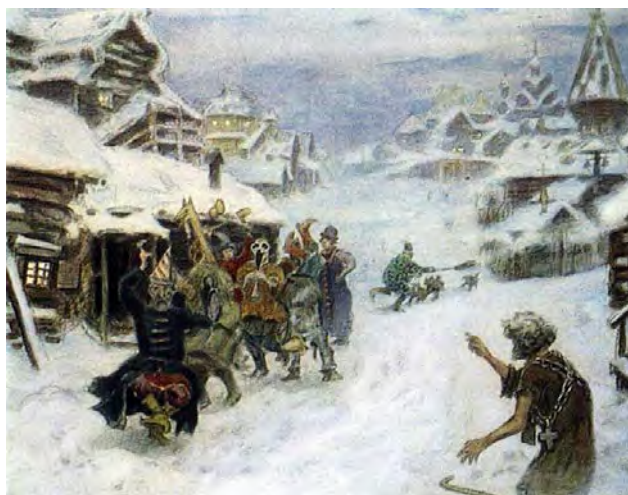
Илл. 13. А.М. Васнецов. «Средневековая Москва. Скоморохи». 1904 г. Бумага серая, наклеенная на картон, акварель, белила, гуашь, уголь, 46,5 x 60,8 см // Государственная Третьяковская галерея (Москва)

В конце 1910-х годов художником были исполнены эскизы мебели в русском стиле, сделаны различные зарисовки народного орнамента и т.д. Все это свидетельствует о весьма широком круге интересов мастера, его трудолюбию