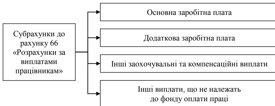
Рис. 2. Аналітичні рахунки 1-го порядку до субрахунків рахунку 66 «Розрахунки за виплатами працівникам»