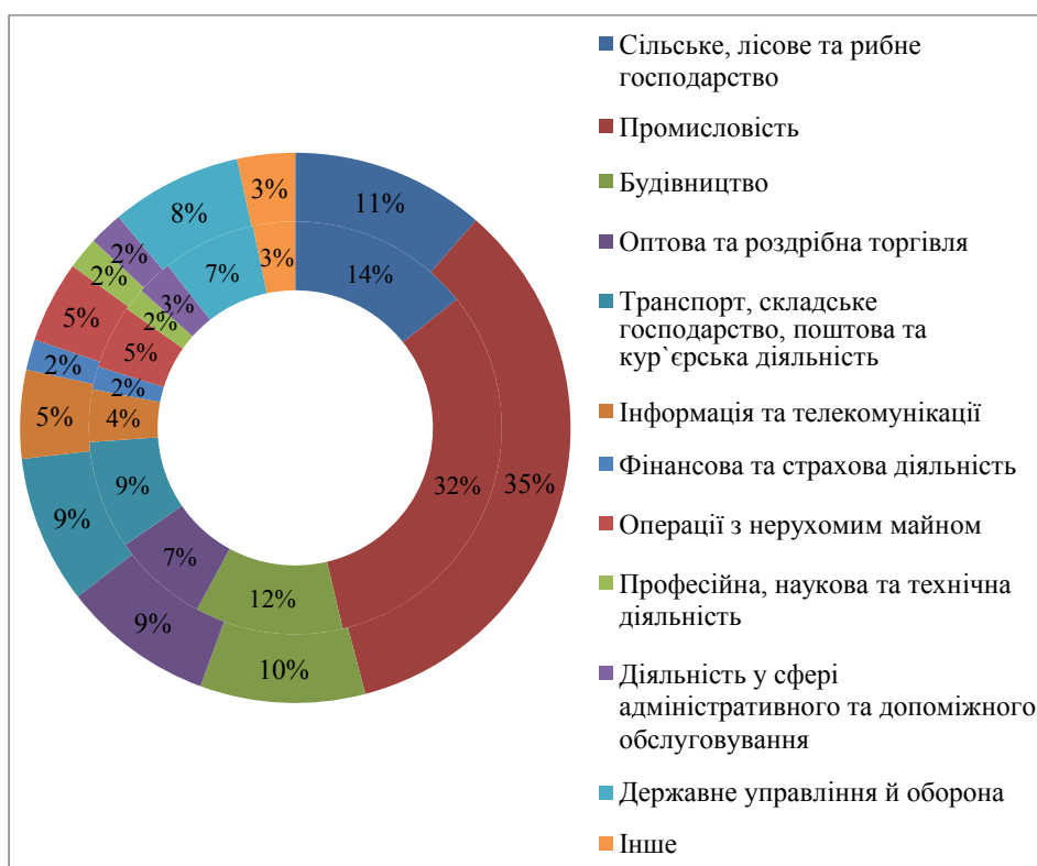
Рис. 2. Капітальні інвестиції за видами економічної діяльності за період 2017-2018 років у відсотках (за 2017 рік – внутрішнє коло, за 2018 рік – зовнішнє коло)

Джерело: розроблено авторами за даними [4]