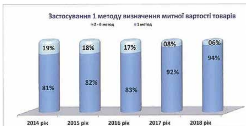
Рис. 1. Результати діяльності митних органів згідно оцінки їх ефективності діяльності

ДФС з метою встановлення достовірної і повної інформації про рівень вартості імпортованих в Україну товарів здійснювались заходи із підготовки та направлення запитів до митних