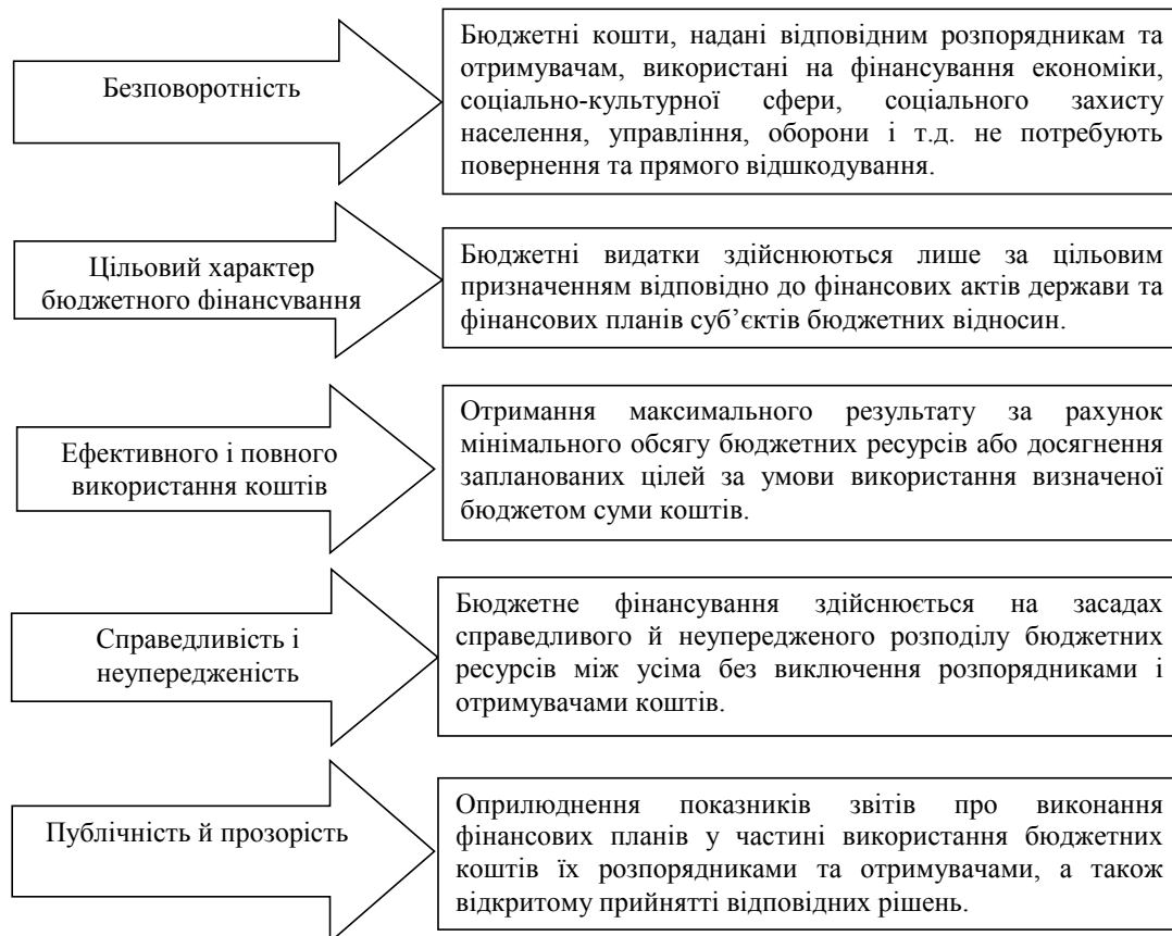
Рис. 1. Принципи фінансування бюджетних установ та організацій

Посередником в даному випадку являється банківська установа, де відкрито єдиний казна-