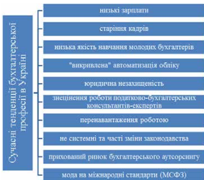
Рис. 2. Сучасні тенденції бухгалтерської професії в Україні

Першочерговим заходом щодо удосконалення розвитку бухгалтерської професії є розвиток аутсорсингових компаній. Вони залучають до себе найкращих та найосвіченіших представників професії та можуть запропонувати їм гідну оплату праці, а ще надають можливість постійно розвиватися. Крім того, вони ж будуть основними замов-