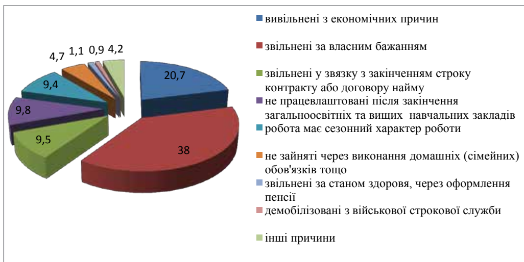
Рис. 2. Структура безробітного населення України за причинами незайнятості у 2018 році