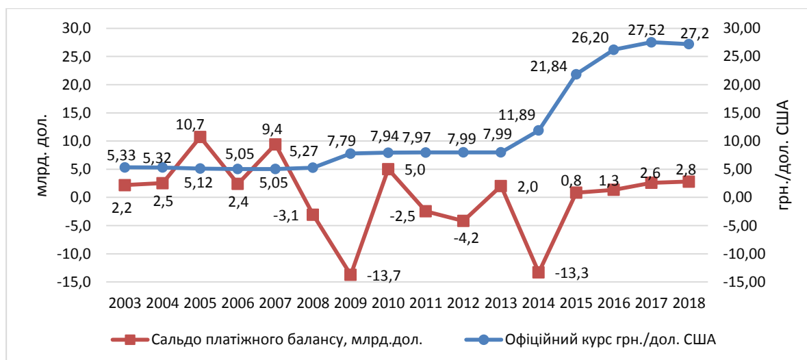
Рис. 3. Вплив обмінного курсу на платіжний баланс України [3; 8; 9]