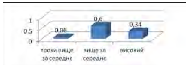
Рис. 4. Розподіл питомої ваги курсантів 21-24 років у відповідності до шкали здатностей до самоосвіти та саморозвитку