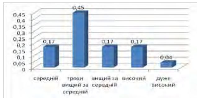
Рис. 3. Розподіл питомої ваги курсантів 17-20 років у відповідності до шкали здатностей до самоосвіти та саморозвитку

В. Буряк виділив чотири важливі елементи готовності до самоосвіти [2]: цілісний емоційно-особистісний апарат (внутрішня потреба в самовдосконаленні, особистісні цінності, загальні розумові здібності тощо); система знань, умінь, навичок із самоосвіти, яку засвоює особистість (повнота і глибина сформованості наукових понять, взаємозв'язків між ними, уміння співвідносити наукові поняття з об'єктивною реальністю тощо); уміння та навички грамотно працювати з основними джерелами соціальної інформації, бібліографічними системами, автоматизованими інформаційно-пошуковими засобами, радіо, телебаченням, спеціалізованими лекторіями; сис-