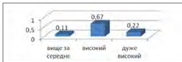
Рис. 5. Розподіл питомої ваги курсантів 25-29 років у відповідності до шкали здатностей до самоосвіти та саморозвитку

тема організаційно-управлінських умінь і навичок (ставити й виконувати завдання самоосвіти, планувати свою роботу, вміло розподіляючи час на різноманітні обов'язки, створювати сприятливі умови для діяльності, здійснювати самоконтроль, самоаналіз результатів і характеру самодіяльності тощо).