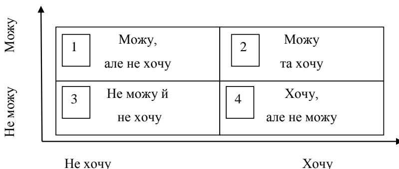
Рис. 6. Матриця розподілу за рівнем здатності та готовності до самоосвіти

На наш погляд, аналізувати здатність та готовність до самоосвітньої діяльності із подальшим пошуком шляхів її розвитку, можна за допомогою наступної матриці (рис. 6).