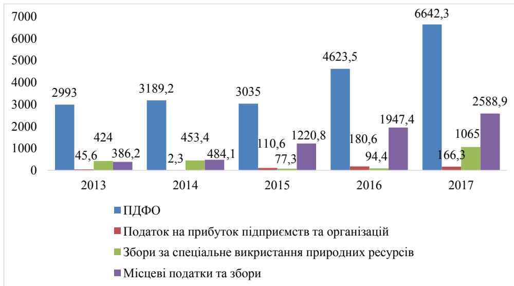
Рис. 2. Основні податкові надходження до Зведеного бюджету Львівської області, млн грн