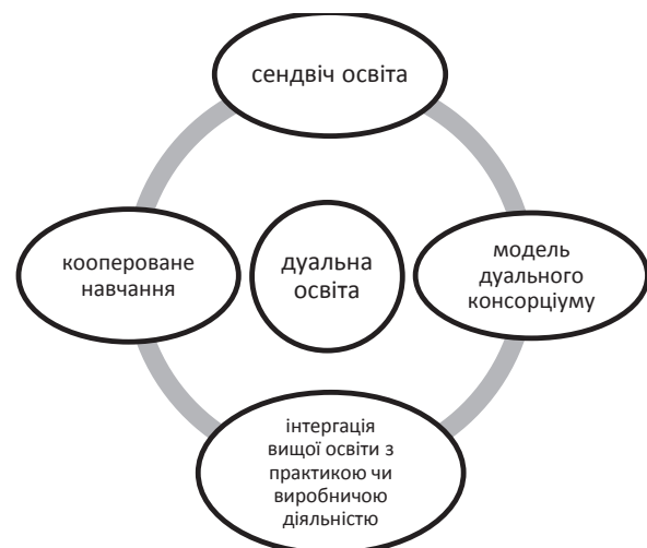
Рис. 1. Моделі дуальної освіти

На рис. 1 представлені різні моделі дуальної освіти, що функціонують у закладах вищої освіти різних країн світу: