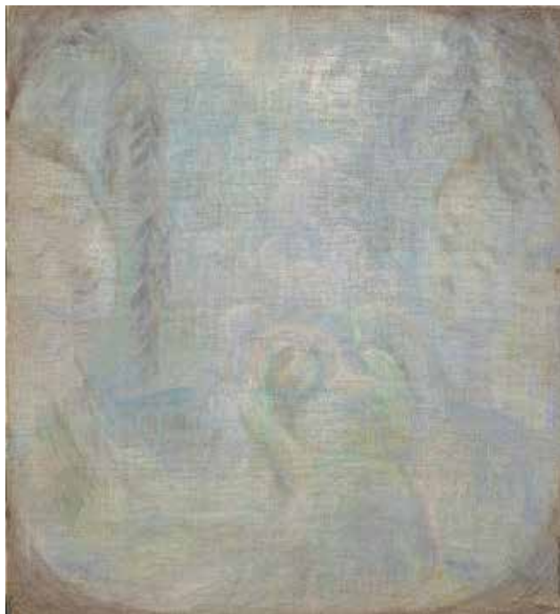
Илл. 3. П.В. Кузнецов. «Рождение». 1906 г. Холст, пастель, 73,0 × 66,0 см // Государственная Третьяковская галерея (Москва)

Однако, «Голубая роза» стала центром символистского движения, и П.В. Кузнецов оставался ее лидером [7, с. 21]. В каждой из композиций картин «Мираж в степи» (1912), «Дождь в степи» (1912), «Вечер в степи» (1912), «В кошаре» (1910) П.В. Кузнецов изображает какой-то эпизод, подмеченный в реальной жизни, или вполне будничное действие из повседневного быта, все это –