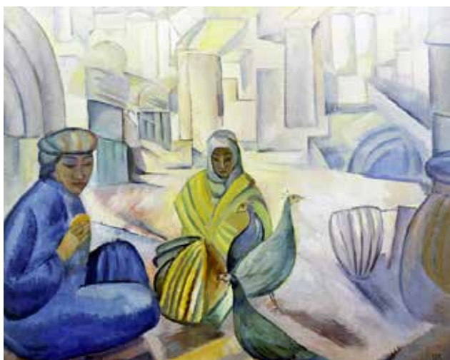
Илл. 15. П.В. Кузнецов. «Птичий базар». 1913 г. Холст, масло, 72,0 × 92,0 см // Государственный Русский музей (Санкт-Петербург)

этих предметов [4, с. 31]. Таким образом, в двух последних натюрмортах П.В. Кузнецова чисто пластически, связанных и с «Бухарским натюрмортом», и с «Цветами и дынями», и с «Натюрмортом в сюзане» есть та же ясность, внутренняя классичность, далекая от вторичности, возникшего, тогда же неоакадемизма, благородная простота [4, с. 32].