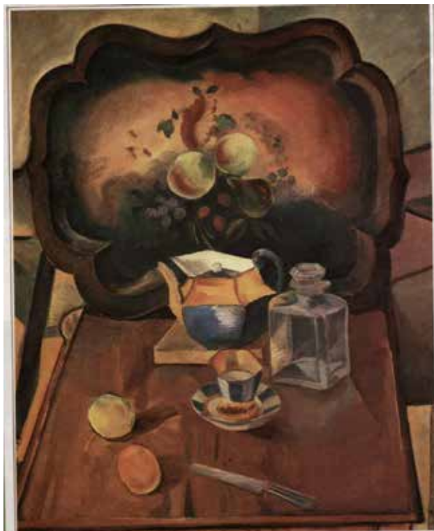
Илл. 16. П.В. Кузнецов. «Натюрморт с подносом». 1916 г. Холст, масло, 106,0 × 97,5 см // Государственный Русский музей (Санкт-Петербург)

Незадолго до революции 1917 года, П.В. Кузнецов был призван в армию и направлен в Московскую школу прапорщиков. Откуда был отозван Советом солдатских депутатов, чтобы возглавить художественно-просветительскую комиссию. Одновременно из армии были отозваны и другие художники – Г.Б. Якулов, П.П. Кончаловский, И.И. Машков, А.А. Осмер-