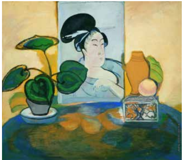
Илл. 9. П.В. Кузнецов. «Натюрморт с японской гравюрой». 1912 г. Холст, темпера, 63,0 × 71,0 см // Частный музей «Арбат Престиж» (Москва)

Здесь, в отличие от «Натюрморта с японской гравюрой», мазок дрожит, трепещет, переда-