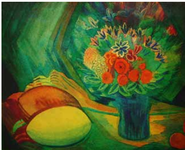
Илл. 11. П.В. Кузнецов. «Цветы и дыни». 1913 г. Картон, темпера, 64,0 × 77,0 см // Собрание А.Ф. Чудновского (Санкт-Петербург)

На первый взгляд, он вызывает ассоциацию с «Голубой скатертью» (1907) Анри Матисса [4, с. 31]. Но, если у Анри Матисса каждое цветовое пятно трактуется очень определенно и вписывается в плоскость, то у П.В. Кузнецова каждый предмет – это кувшин, дыня за ним, фрукты, тарелка – исполнены вибрации оттенков, как и растительный орнамент на сюзане и на поверхности фона. П.В. Кузнецов дает даже намек на пространство, намечая два плана: круглящийся стол, покрытый сюзане, и орнаментализованную стену или ширму. Но, это пространство опять-таки не иллюзорно, оно не мешает ритмике, изгибающихся линий орнамента, а ощущение воздуха, возникающее и от бархатистости фактуры, и от многообразия оттенков, придает этому натюрморту более