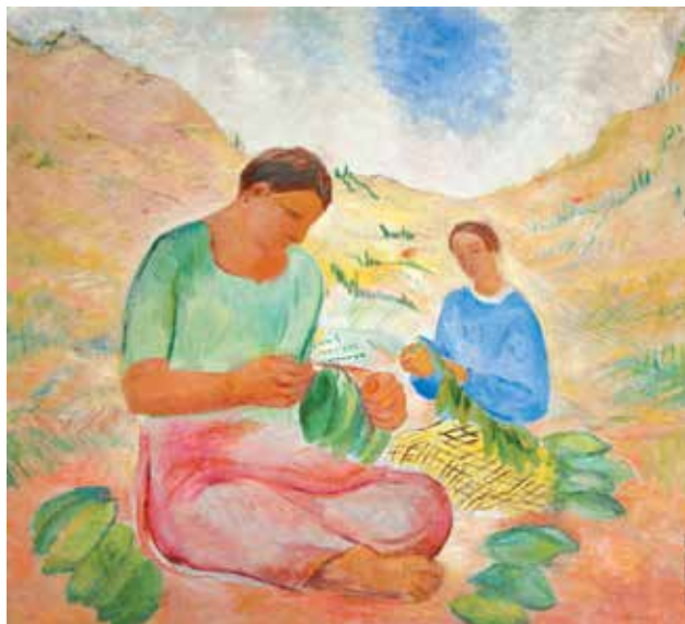
Илл. 21. П.В. Кузнецов. «Табачницы». 1925-1926 гг. Холст, масло, 97,0 × 107,0 см // Государственный Русский музей (Санкт-Петербург)