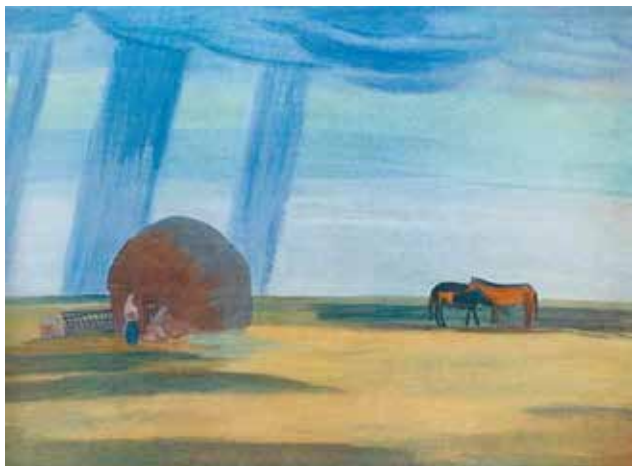
Илл. 5. П.В. Кузнецов. «Дождь в степи». 1912 г. Картон, темпера, 52,0 × 70,5 см // Государственный Русский музей (Санкт-Петербург)

ной и ярко-красочной экзотике Востока сказочно гармоничный мир, вроде бы, избавленный от зла, пошлости, мелочности, тщеславия и прочих суетных пороков.