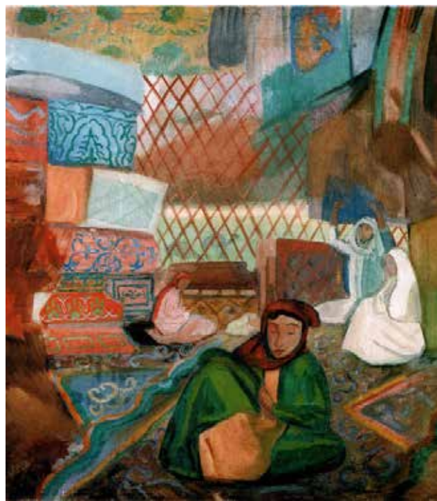
Илл. 7. П.В. Кузнецов. «В кошаре». 1910 г. Холст, масло, 45,0 X 54,0 см // Собрание А.Ф. Чудновского (Санкт-Петербург)

Здесь прямо по центру поставлена гравюра Утамаро, ее фланкируют справа растение в горш-