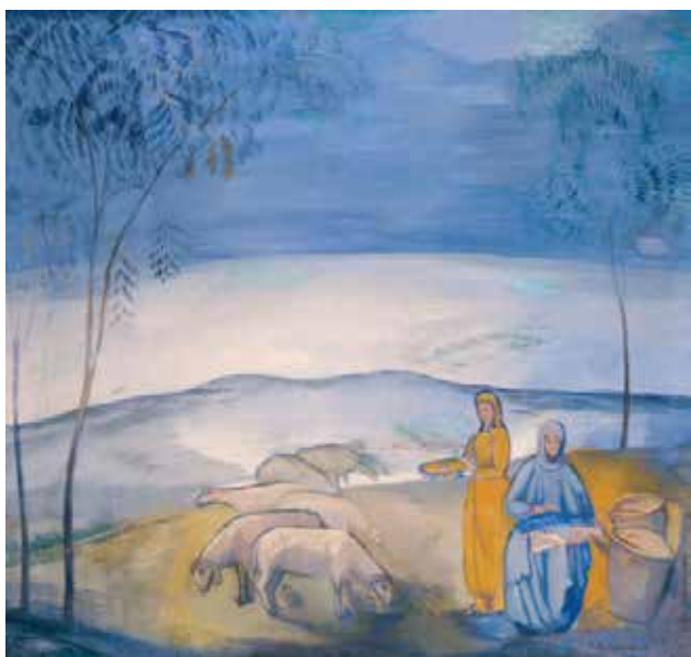
Илл. 6. П.В. Кузнецов. «Вечер в степи». 1912 г. Холст, темпера, 98,0 × 105,0 см // Государственная Третьяковская галерея (Москва)

Соприкосновение с ним дарует радость, спокойствие, душевную ясность, вдохновение. Отсюда, поэтичная созерцательность и восторженная мечтательность работ из «Киргизской сюиты» [7, с. 21]. Отсюда, изысканность и красота цветовых сочетаний чистых, прозрачных, пронизанных светом голубых, зеленовато-золотистых тонов, струящихся, мерцающих, словно бы звучащих нежной мелодичной музыкой. Характерное для «Киргизской сюиты» стремление к обобщению претворяется пока, что несколько нарочитым приемом: позы не отличаются разнообразием, лица – похожи. И сам тип кузнецовского персонажа нарочито легко узнаваем, поскольку это именно тип, а не конкретный