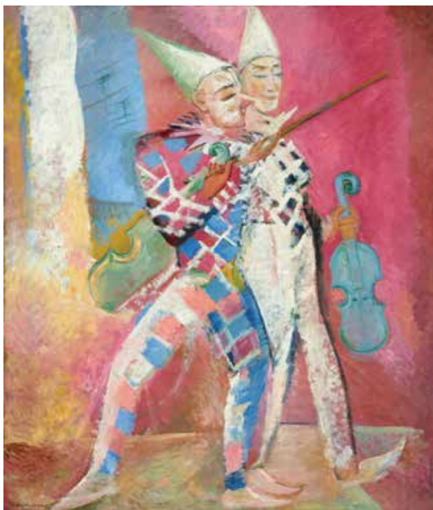
Илл. 18. П.В. Кузнецов. «Парижские комедианты (Национальный праздник в честь революции)». 1925 г. Холст, масло, 116,0 × 98,0 см // Государственная Третьяковская галерея (Москва)