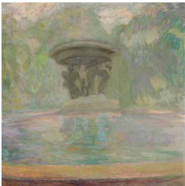
Илл. 1. П.В. Кузнецов. «Фонтан». 1904 г. Холст, темпера, пастель, 99,0 × 96,5 см // Государственный музей искусств Республики Казахстан имени А. Кастеева (Алма-Ата)

ту сразу после ее окончания, он впоследствии ставил на ней год совершенно произвольно. «Дата не имеет никакого значения, – ответил он однажды на вопрос советского и российского искусствоведа А.А. Русаковой (1923-2013) по поводу