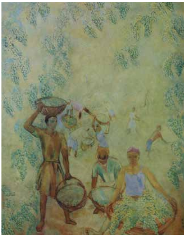
Илл. 20. П.В. Кузнецов. «Сбор винограда». 1928 г. Холст, масло, 178,0 × 142,5 см // Государственный Русский музей (Санкт-Петербург)