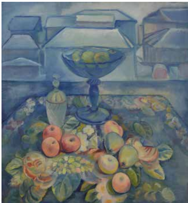
Илл. 14. П.В. Кузнецов. «Натюрморт. Утро». 1916 г. Холст, масло, 106,0 × 97,5 см // Государственная Третьяковская галерея (Москва)