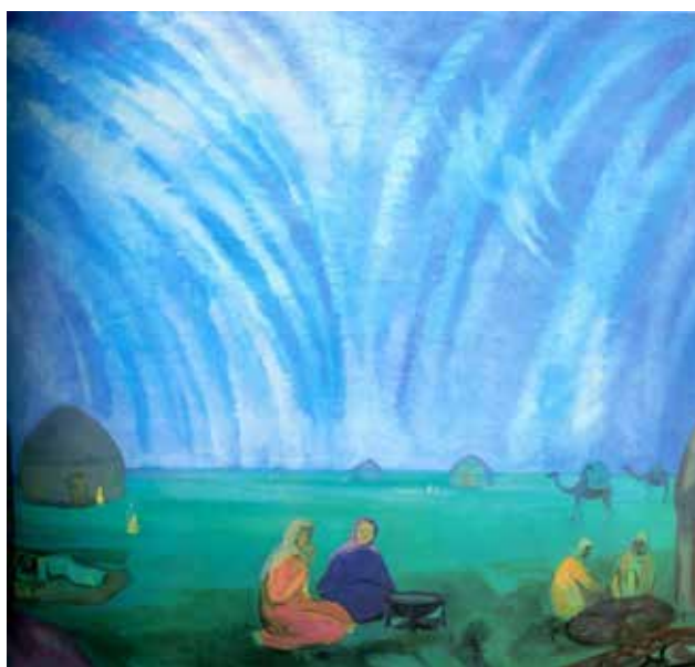
Илл. 4. П.В. Кузнецов. «Мираж в степи». 1912 г. Холст, темпера, 95,0 × 103,0 см // Государственная Третьяковская галерея (Москва)

Здесь бытие. Степных кочевников, вообще людей... Ведь время не властно над тем, что вечно. Потому, так необъятна степь и бездонно небо. Спокойны и величавы люди, плавны и неспешны их движения, просты и естественны их позы, воссоздающие, характерную пластику Востока, отшлифованную веками. На многие годы жизнь кочевников, степь стали любимыми темами П.В. Кузнецова, открывшего в мираж-