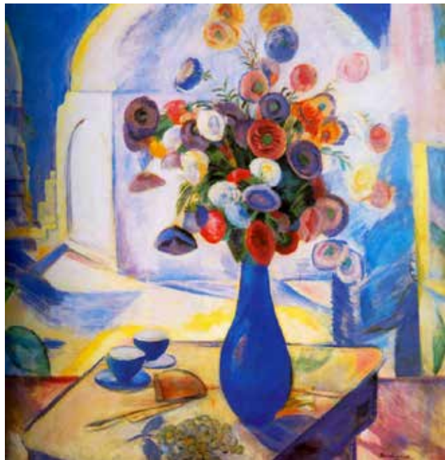
Илл. 10. П.В. Кузнецов. «Бухарский натюрморт». 1913 г. Холст, темпера, 73,0 X 74,0 см // Саратовский государственный художественный музей имени А.Н. Радищева (Саратов)

вая, как бы некоторое излучение, идущее от золотой дыни, синей вазы, оранжевых, голубых и розовых цветов в ней [4, с. 30]. Благодаря этому создаются богатейшие переливы красок, которые сосредоточены в многоугольнике за букетом. Возникает какой-то чудесный романтический мир, одновременно, лишенный туманной символики раннего «голуборозовского» П.В. Кузнецова [4, с. 31]. Но, тут видно, как этот период не прошел для мастера даром. Благодаря ему, П.В. Кузнецов остался поэтом, найдя более ясный, лаконичный, пластический язык. Его показывает художник и в «Натюрморте с сюзане» (1913) [4, с. 31] (илл. 12).