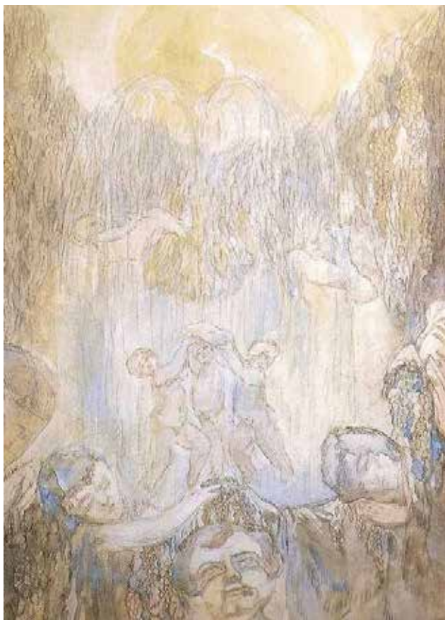
Илл. 2. П.В. Кузнецов. «Фонтан». Эскиз. 1905 г. Бумага, акварель, 51,0 X 34,5 см // Собрание В.А. Дудакова и М.К. Кашуро (Москва)

«степных» работ, – я ставлю на картине первую, пришедшую мне в голову» [8, с. 8]. Следствием этого явилось обилие неточных датировок, прочно, закрепившихся за картинами П.В. Кузнецова. А.А. Русакова, автор книги «Павел Кузнецов» (Л., 1977) – также, разумеется, не застрахованной от неточностей и ошибок – руководствовалась в ряде неясных случаев указаниями художника и сценографа, жены художника – Е.М. Бебутовой (1892-1970), полученными от нее старыми фотографиями выставок и отдельных работ П.В. Кузнецова и другими документальными свидетельствами [8, с. 10]. Цель данной публикации, на основе библиографических источников, раскрыть творчество П.В. Кузнецова – мастера натюрморта, проанализировать его работы.