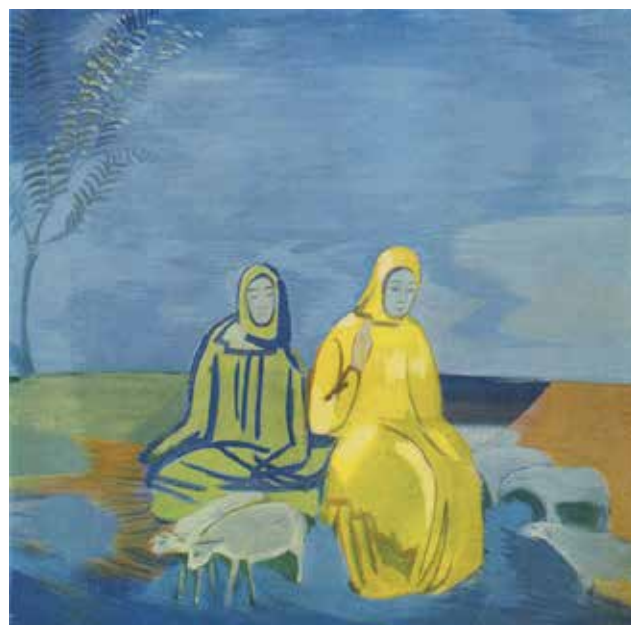
Илл. 13. П.В. Кузнецов. «Вечер в степи». 1915-1916 гг. Холст, темпера, пастель, 76,0 × 80,0 см // Государственный Русский музей (Санкт-Петербург)

Формы здесь особенно кубизированы. Но острота линий, очерчивающих флакон из стекла, фарфоровые кофейник и чашку, снова не подчеркивают «вещности» (выражение П.П. Кончаловского), а говорят о хрупкости