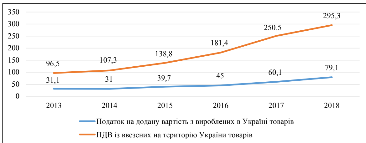
Рис. 2. Динаміка надходжень ПДВ до державного бюджету, млрд грн.

Варто зазначити, що оподаткування зовнішньоекономічної діяльності здійснюється не тільки у фіскальних цілях, а й з метою регулювання економіки. Так, ввізне мито на імпортні товари застосовують для створення сприятли-