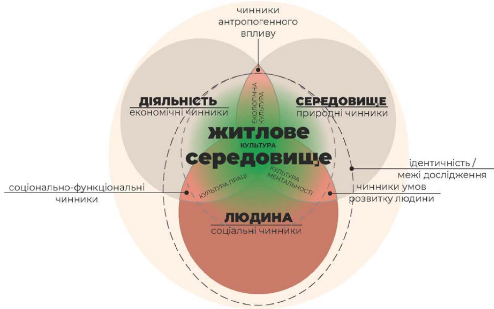
Рис. 2. Скоригована модель макрочинників впливу на житлове середовище