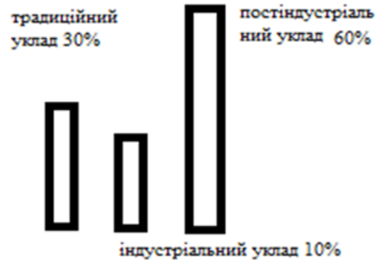
Рис. 1. Соціальні уклади курсантів за методикою «Розвиток цілісної особистості в умовах сучасних змін»

– зміни у мотивації людської активності визначають і якісні зміни самого її типу. Становлення творчості як найбільш поширеної форми виробничої діяльності стане основною складовою гуманістичної трансформації постіндустріального суспільства. При цьому, на відміну від праці, творчість є більш високим і досконалим типом діяльності, адже її спонукальний мотив пов'язаний насамперед з внутрішніми потребами особистості: прагненням до самореалізації, збільшення та розвитку своїх знань та можливостей.