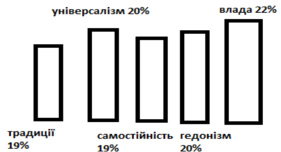
Рис. 2. Склад сімейних цінностей курсантів за методикою Шварца