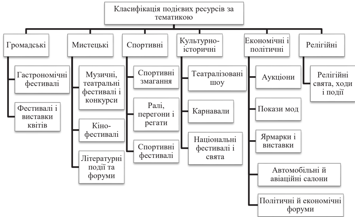
Рис. 1. Класифікація подієвих ресурсів за тематикою [8]

видів туризму, наприклад: екологічного (події, зазвичай, відбуваються просто неба в мальовничих куточках країни, у національних парках та заповідниках); курортно-лікувального (часто фестивалі відбуваються на курортах, завдяки чому і курортник, і активний турист отримують подвійну користь для душі і тіла); навчального (на фестивалях відбуваються тематичні дні, де навчають, наприклад, стрільбі з лука, скелелазін-