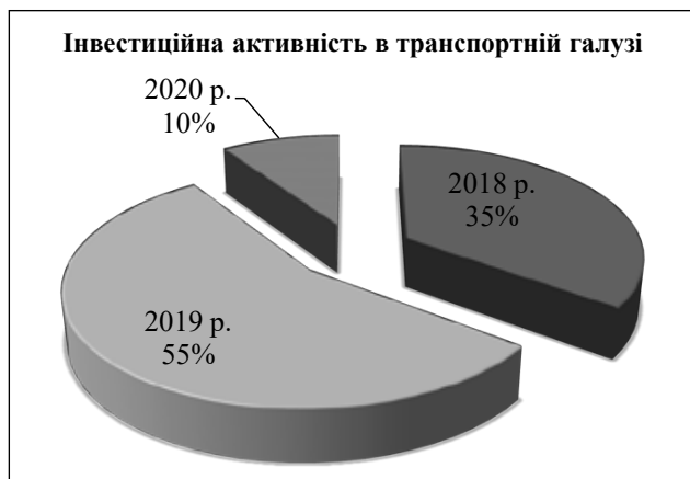
Рис. 2. Інвестиційна активність у транспортній галузі в Україні

з факторів, якій суттєво вплинув на діяльність транспортних підприємств. Це фактор який безпосередньо виник з появою пандемії і на підставі цього спричинило обмеження в діяльності та розвитку транспортної галузі в усьому світі.