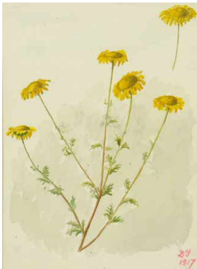
Илл. 10. Д.Н. Ушаков. «Полевые цветы». 1914-1918 гг. Бумага, картон, акварель // ЦМАМЛС. Ф. 276. Оп. 1. Д. 82. Л. 8.

когда открылись архивы ОГПУ, стало известно, что и над самим Дмитрием Николаевичем тогда сгущались тучи. В протоколах допросов арестованных постоянно фигурировало его имя, как одного из руководителей «контрреволюционной фашистской организации», это означало приговoreние к аресту [3, с. 467]. Однако в какой-то момент вдруг в показаниях начала записываться фраза: «Ушаков – антисоветски настроенный человек, но мне неизвестно, был ли он членом организации»; на понятном лишь посвященном диалекте ОГПУ это означало: Д.Н. Ушаков более не разрабатывается [3, с. 467]. Причина спасения остается неизвестной. Одна из возможных гипотез: Дмитрия Николаевича кто-то, например, сам И.В. Сталин, не давший по этому же делу санкцию на арест В.И. Вернадского (1863-1945), счел нужным специалистом, особенно в связи со словарем, работа над которым в 1934 году была в разгаре. Знаменитый его «Орфографический словарь», многократно издававшийся при его жизни (впервые в 1935 году) и после его смерти (к 1990 году было сорок одно издание), известен не одному поколению школьников [3, с. 468]. Важно отметить, что именно в 1920-1930-е годы, вопросы нормы, в т.ч. орфографической, были очень актуальны. Хотя новая орфография была проще старой и усваивалась легче, но после революции русский литературный язык значительно распространился вширь, включив в число своих носителей массы рабочих и крестьян, часто овладевавших языковой нормой не полностью.