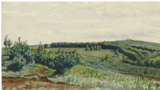
Илл. 1. Д.Н. Ушаков. «Подмосковье. Юрьево». 1902 г. Бумага, акварель // ЦМАМЛС. Ф. 276. Оп. 1. Д. 74. Л. 2.

ма (во времена Д.Н. Ушакова у нас этот термин еще не был в ходу, но суть была именно такой). И, наиболее, крупные из учеников Дмитрия Николаевича пошли по этому пути, а их учитель остался в эпохе Ф.Ф. Фортунатова.