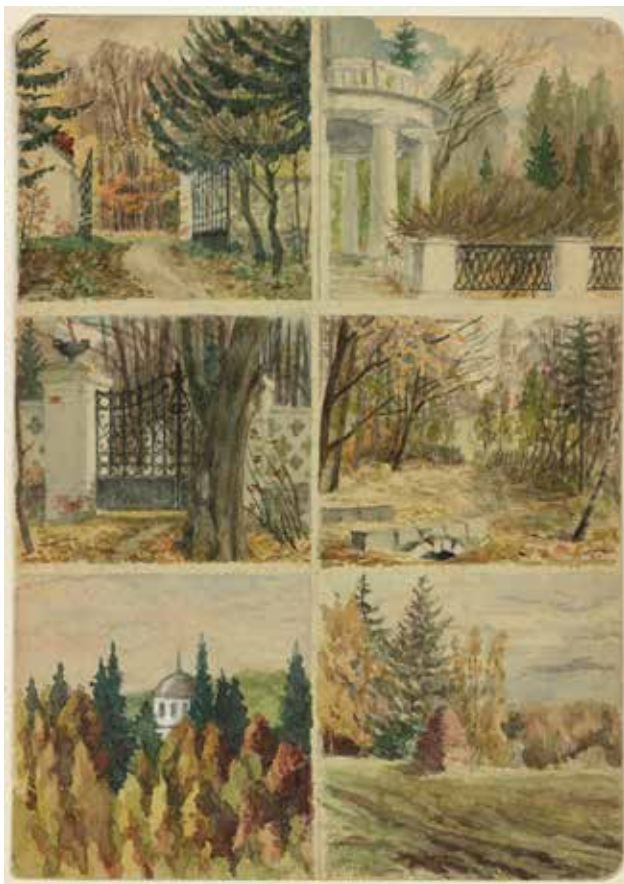
Илл. 5. Д.Н. Ушаков. «Подмосковье. Никольское». 1920 г. Бумага, акварель // ЦМАМЛС. Ф. 276. Оп. 1. Д. 83. Л. 12.

Этот стиль акварельной миниатюры, который был характерен не только для кленовых листьев, но и для полевых цветов, был присущ Дмитрию Николаевичу органически и проявлялся во всем, будь, то лекция, статья, обработка словарного абзаца или забавная поговорка, удачный каламбур или ладно скроенный анекдот (илл. 9, 10).