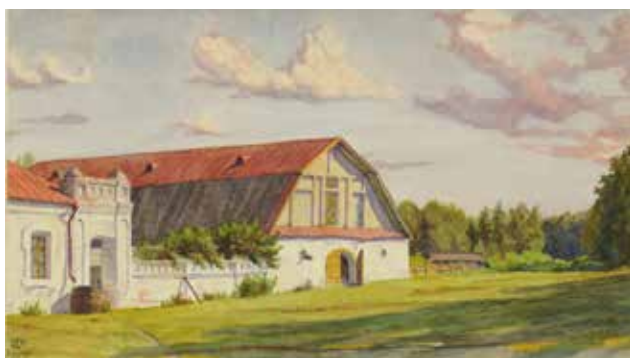
Илл. 3. Д.Н. Ушаков. «Прохорово». 1914-1918 гг. Бумага, карандаш, акварель