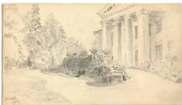
Илл. 13. Д.Н. Ушаков. «Узкое». Рисунок из альбома с рисунками. 1923 г. Бумага, карандаш // ЦММЛС. Ф. 276. Оп. 1. Д. 109. Л. 5.