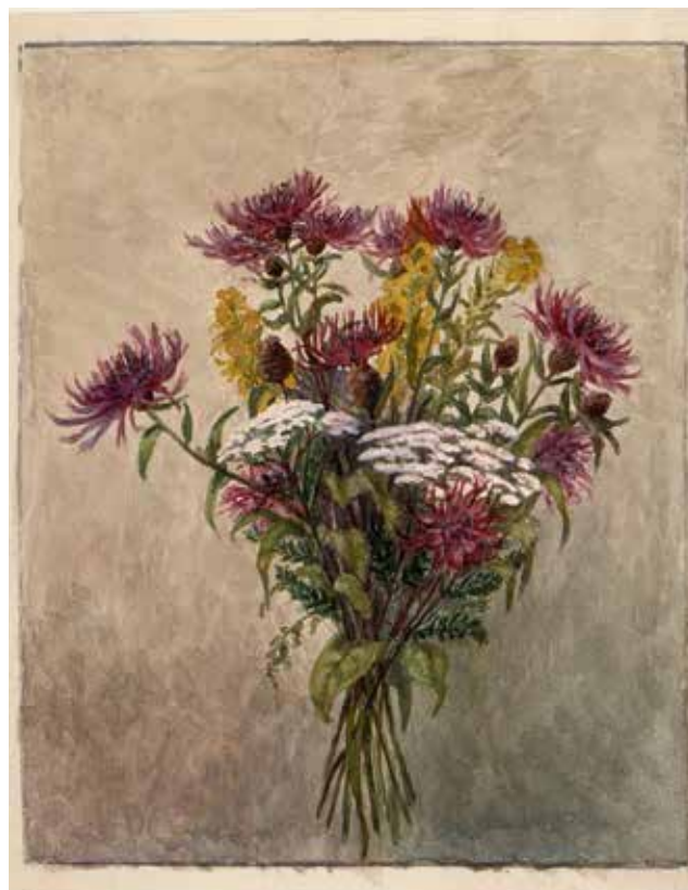
Илл. 9. Д.Н. Ушаков. «Букет полевых цветов». [1920-е-1930-е гг.] Бумага, акварель, 19,2 × 15,8 см // ЦМАМЛС. Ф. 276. Оп. 1. Д. 90. Л. 2.

когда открылись архивы ОГПУ, стало известно, что и над самим Дмитрием Николаевичем тогда сгущались тучи. В протоколах допросов арестованных постоянно фигурировало его имя, как одного из руководителей «контрреволюционной фашистской организации», это означало приговoreние к аресту [3, с. 467]. Однако в какой-то момент вдруг в показаниях начала записываться фраза: «Ушаков – антисоветски настроенный человек, но мне неизвестно, был ли он членом организации»; на понятном лишь посвященном диалекте ОГПУ это означало: Д.Н. Ушаков более не разрабатывается [3, с. 467]. Причина спасения остается неизвестной. Одна из возможных гипотез: Дмитрия Николаевича кто-то, например, сам И.В. Сталин, не давший по этому же делу санкцию на арест В.И. Вернадского (1863-1945), счел нужным специалистом, особенно в связи со словарем, работа над которым в 1934 году была в разгаре. Знаменитый его «Орфографический словарь», многократно издававшийся при его жизни (впервые в 1935 году) и после его смерти (к 1990 году было сорок одно издание), известен не одному поколению школьников [3, с. 468]. Важно отметить, что именно в 1920-1930-е годы, вопросы нормы, в т.ч. орфографической, были очень актуальны. Хотя новая орфография была проще старой и усваивалась легче, но после революции русский литературный язык значительно распространился вширь, включив в число своих носителей массы рабочих и крестьян, часто овладевавших языковой нормой не полностью.