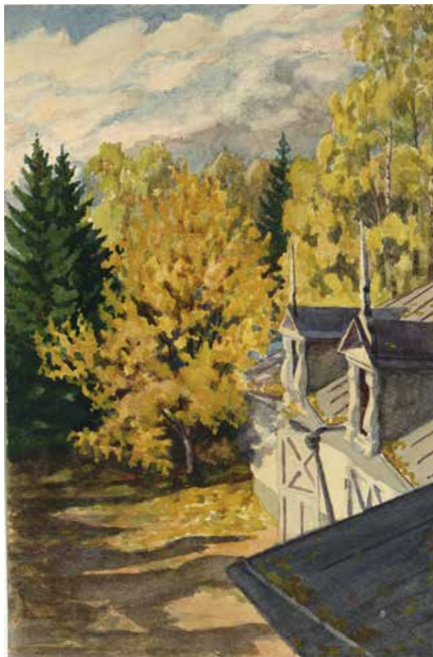
Илл. 12. Д.Н. Ушаков. «Санаторий Узкое». 1923-1927 гг. Бумага, акварель // ЦММЛС. Ф. 276. Оп. 1. Д. 84. Л. 16.

1942 года Дмитрия Николаевича не стало. Похоронен он был в Ташкенте.