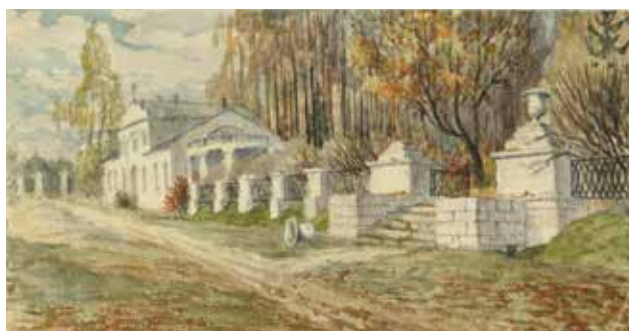
Илл. 4. Д.Н. Ушаков. «Подмосковье. Никольское». 1920 г. Бумага, акварель // ЦМАМЛС. Ф. 276. Оп. 1. Д. 83. Л. 8.

Отдыхая часто осенью в Болшеве, Дмитрий Николаевич привозил оттуда обычно коллекцию своих акварельных рисунков, где особое место занимали «небеса» (и чистые, и с различной причудливой раскраской облаков) и листья, в которых его больше всего привлекали разноцветные прожилки кленовых вырезных листьев (илл. 6, 7, 8) [12, с. 97].