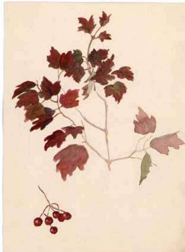
Илл. 7. Д.Н. Ушаков. «Листья. Наброски». [1920-е-1930-е гг.] Бумага, акварель // ЦМАМЛС. Ф. 276. Оп. 1. Д. 92. Л. 2.