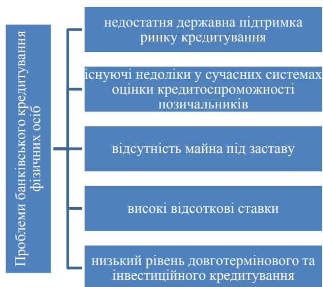
Рис. 3. Проблеми банківського споживчого кредитування фізичних осіб