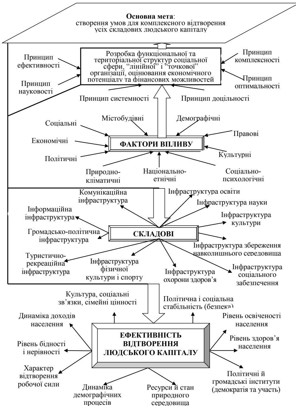
Рис. 2. Структурно-логічна схема розбудови соціально-культурної інфраструктури відповідно до вимог ефективності відтворення людського капіталу

З удосконаленням соціально-культурної інфраструктури досягатиметься економія зусиль, що докладаються кожним індивідом для пошуку